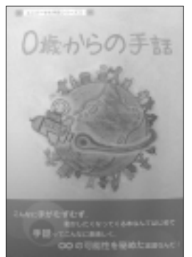
『ユニバーサル手話シリーズ1』 0歳からの手話 定価：1,260円 (本体価格1,200円) 著者編：(株)UDジャパン

手話で学ぼう。本書は「手話」だけでなく、ことばの持つ意味やマナーなどもあわせて学べるようになっている。 職場の中で、障害のある人が生き生きと働けるように作られた一冊である。 ***** UDジャパンは、「これらは福祉の本ではない。障害があってもなくても、同じ人間としてコミュニケーションをとり、持てる能力を伸ばして社会に役立ち、人生を豊かにしていこう。そのために障害の有無にかかわらず、共に考え学ぶための『ビジネス書』として位置づけている。