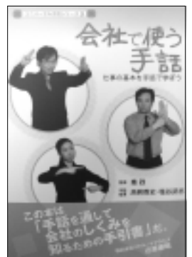
『ユニバーサル手話シリーズ3』 会社で使う手話 仕事の基本を手話で学ぼう 定価：1,575円 (本体価格1,500円) 監修：秦 政 手話指導：高桐尊史、塩谷武志

【ご紹介した書籍のお問い合わせ先】 ■ 発行共に (株)UDジャパン 株式会社ユーディー・ジャパン 住所：〒108-0075 東京都港区港南2-12-27 イケダヤ品川ビル3F 電話：03-5769-0212 FAX：03-5460-0240 Eメール：info@ud-japan.com URL：http://www.ud-japan.com/index.html